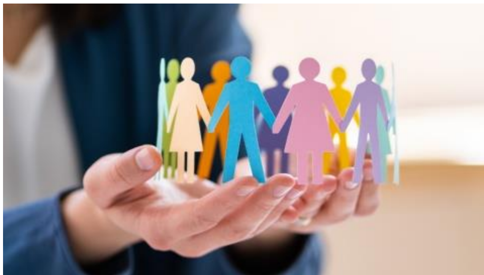
Obtenido de